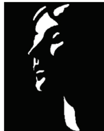
Fig. 1. Stimuli vizuali utilizați în studiul legării perceptuale. A. Stimuli de tip "visual search". B. Stimul de tip "Mooney face" utilizat în studiul legării perceptuale la pacienți schizofreni.